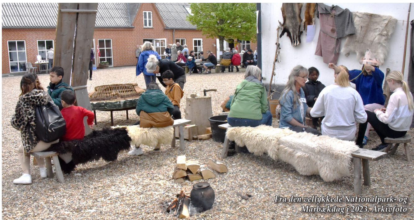
Fra den vellykkede Nationalpark- og Marbækdag i 2023.

”På Myrthuegård kan du opleve foredrag om at være sund i naturen. På Midtgård kan børn i følge