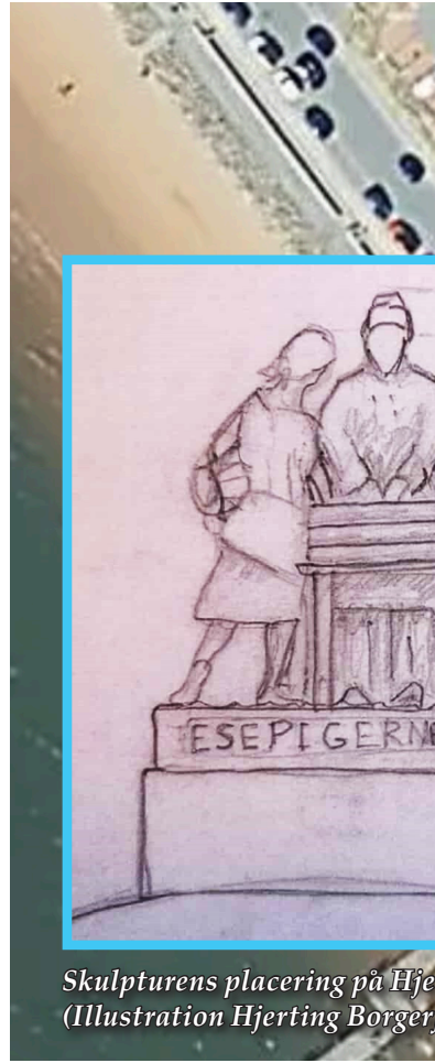
Skulpturens placering på Hjerting Strandvej. (Illustration Hjerting Borgerforening)

Placeringen er nøje udvalgt; det er præcis her ved Strandpromenaden, at kvinderne i sin tid klargjorde grejet. Selvom projektet kræver et areal på knap 90 kvadratmeter og dermed inddrager fire eksisterende parkeringspladser,