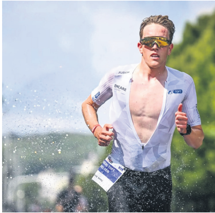
Løbet var en halvmaraton på 21,2 kilometer, alt i tiden 3:56.