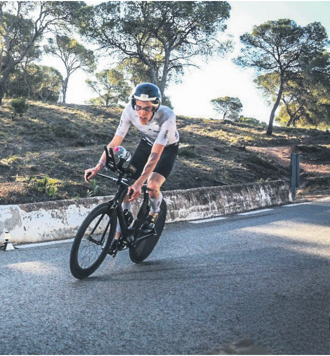
r, da det var mellemdistancen.