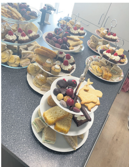
I Café & Butik Dyreborg kan man nyde 'five o'clock tea' med kager.