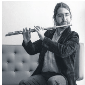
De to kunstnere, der optræder i Guldager.