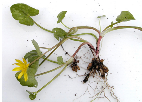
Her ses plantens vorterødder.

Vorterod hentyder til de opsvulmede ammerødder. Vorterod er indført til Danmark i middelalderen og har fundet anvendelse som middel mod hæmorrider, skørbug (planten er c-vitaminrig og blev kaldt skørbugskål) og fnat. På grund af de underjordiske, knoldagtige ammerødder og yngleknopperne, tillagde man også planten kræfter over for bylder og bygkorn, for datidens signaturlære