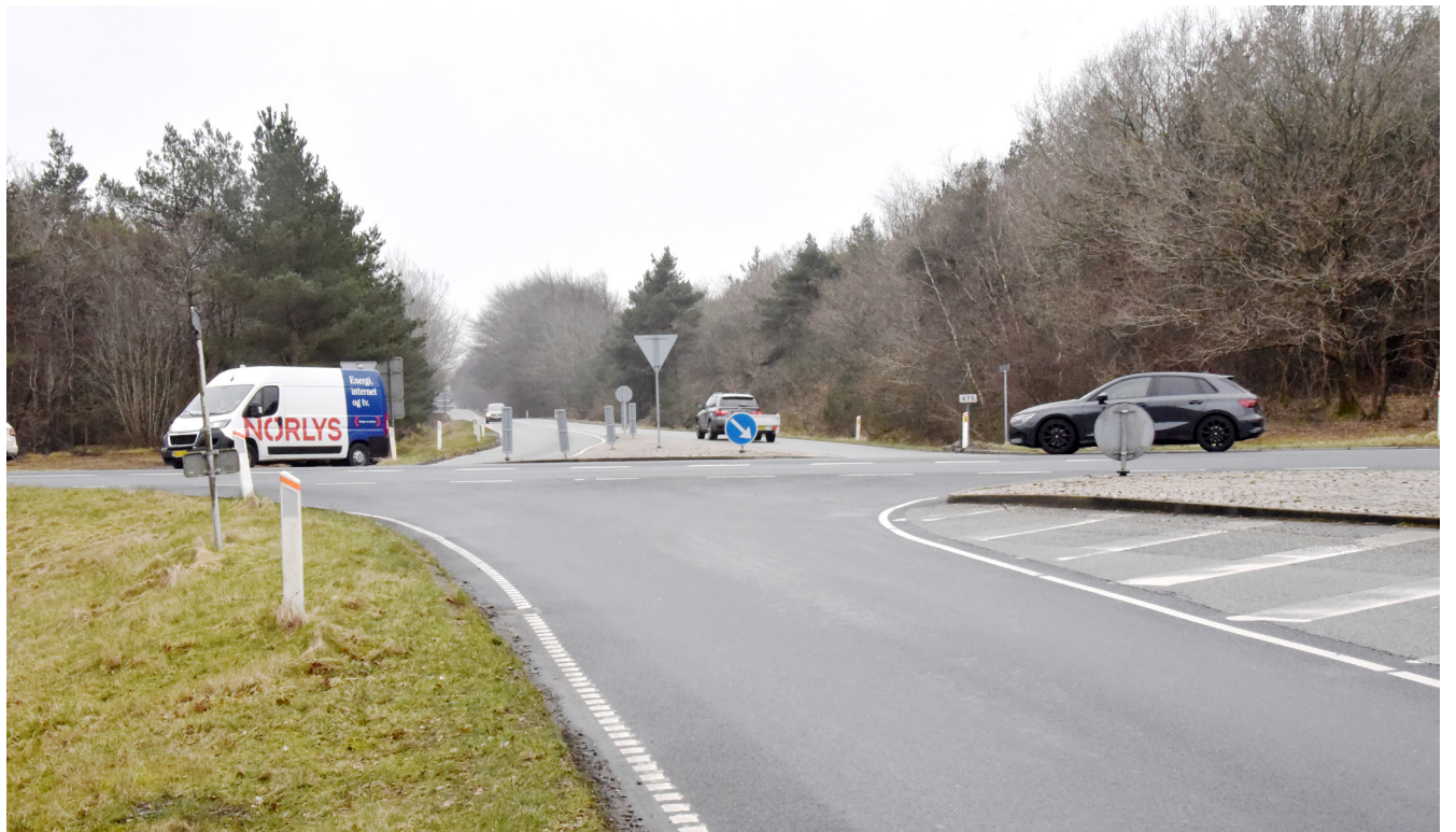
Krydset Hjerting-Landevej-Vestkystvej er et travlt kryds med mange hurtigtkørende køretøjer på Vestkystvej.

Selve området 6710 har det godt. Nu har vi også bevis for, at borgerne her lever meget længere end i bymidten. Så lad os da nyde det. God påske!