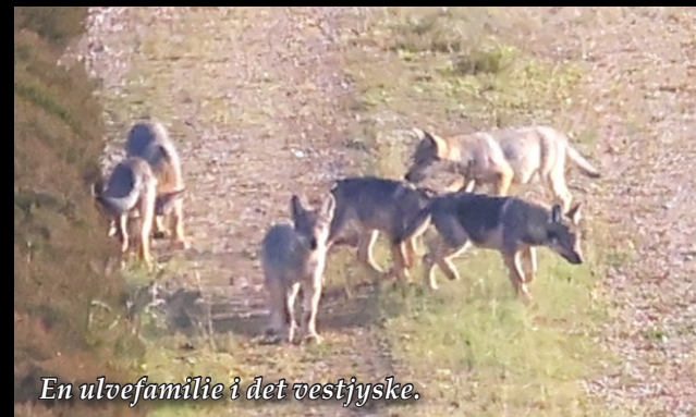
En ulvefamilie i det vestjyske.

Det vil vi gerne vise læsere af Hjerting Posten og Fanø Posten. Derfor vil vi i samarbejde med Nationalpark Safari invitere vores læsere på Ulvesafari i det Sydvestjyske. Du vil kunne læse mere om disse arrangementer i de næste numre af aviserne, når mulighederne vurderes optimale. På turen vil vi vise dig ulven og fortælle alt om ulven.