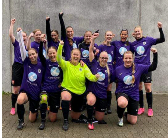
De stolte spillere.

HJERTING – Til foråret skifter HIF Fodbolds dame senior hold serie 2 ud med serie 1. Efter et brag af en holdindsats sluttede damernes kamp mod FC King George 2-0 til HIF, og oprykningen kom i hus. HIF Fodbolds ledelse er naturligvis begejstret og forventer at se flere tilskuere ved lægterne i sæson 2024. Herfra skal også lyde et stort tillykke!