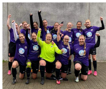
De stolte spillere.

HJERTING – Til foråret skifter HIF Fodbolds dame senior hold serie 2 ud med serie 1. Efter et brag af en holdindsats sluttede damernes kamp mod FC