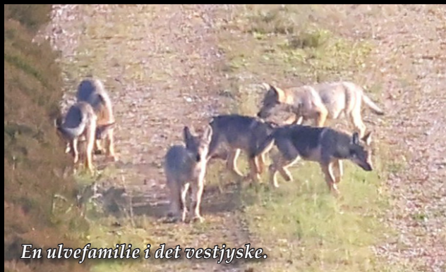
En ulvefamilie i det vestjyske.