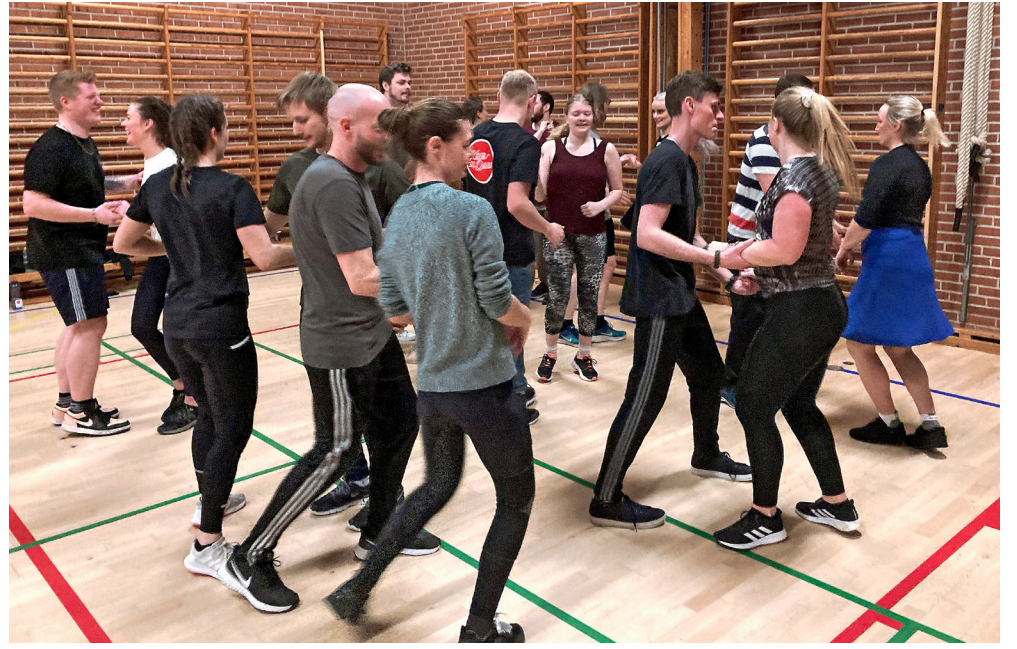
Pardans er en populær aktivitet, når der er Sønderrisdage.