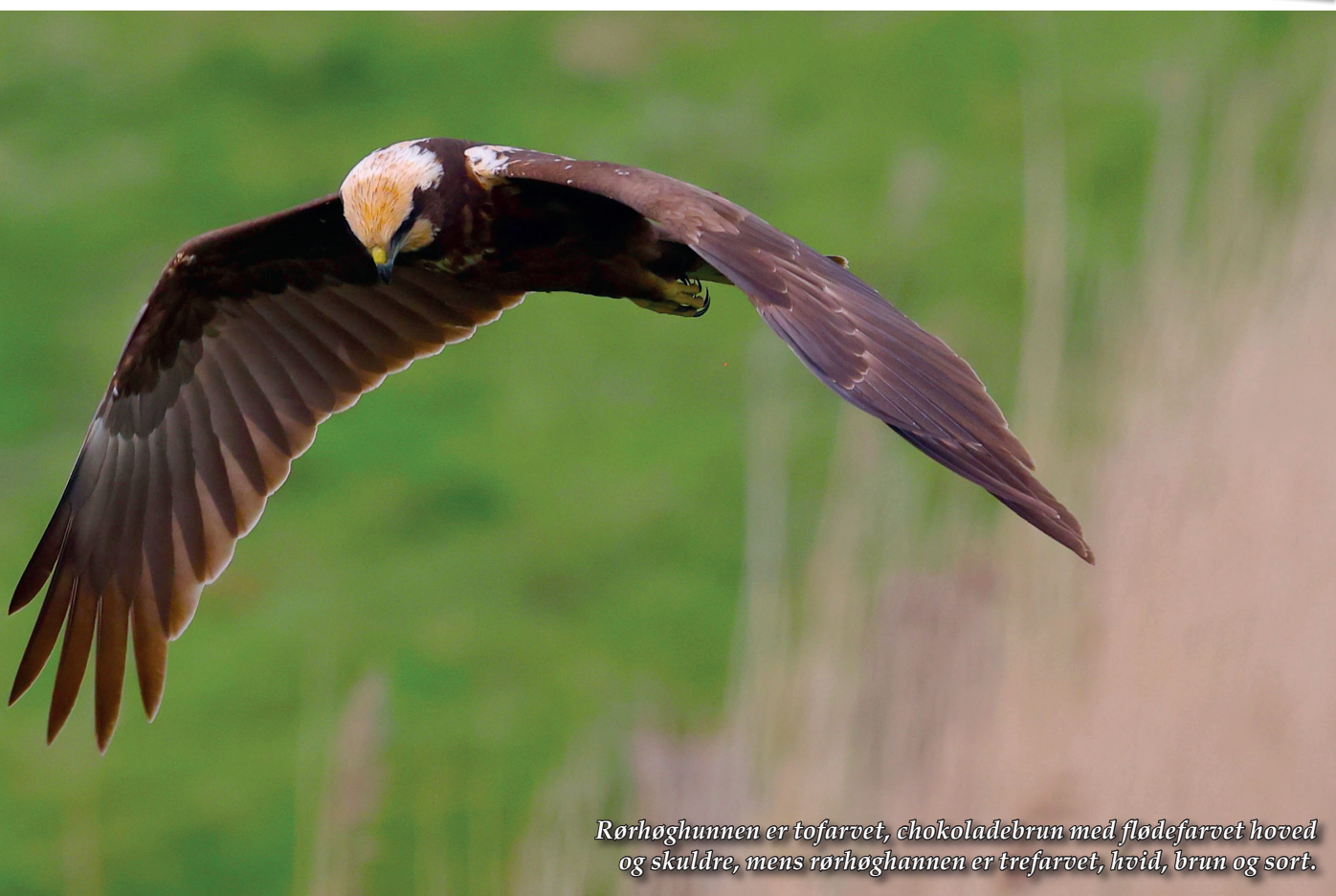
Rørhøgungen er tofarvet, chokoladebrun med flødefarvet hoved og skuldre, mens rørhøgungen er trefarvet, hvid, brun og sort.

august og vide, at nu starter den store rejse, der først bringer dem mod Rømø, Mandø og Sild for derefter at trække ned gennem Europa.