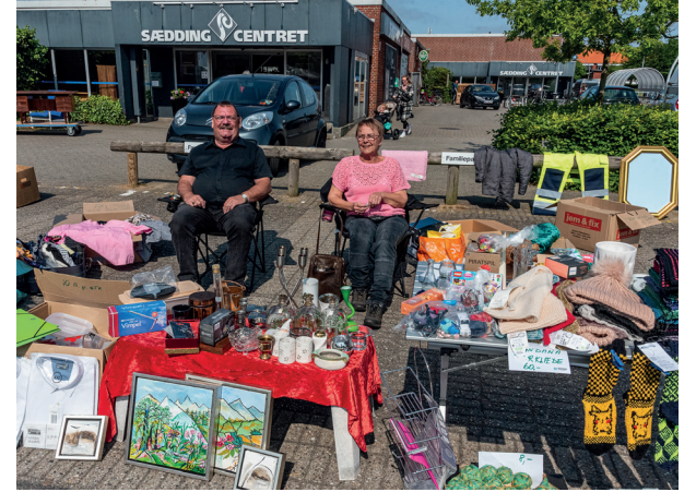
Stemningen var fin ved det første marked i pinsen.