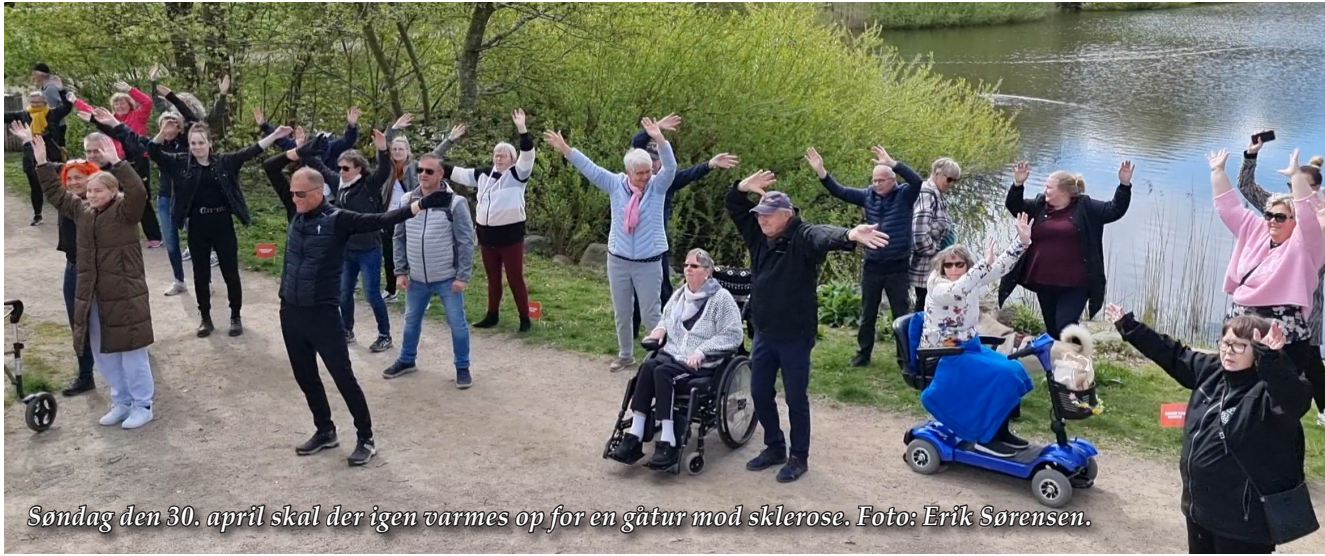
Søndag den 30. april skal der igen varmes op for en gåtur mod sklerose.