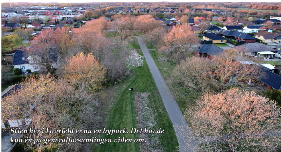
Stien her i Fovrfeld er nu en bypark. Det havde kun én på generalforsamlingen viden om.

"Det eneste positive ved materialet til udvalgets drøftelse er et forslag fra Styregruppen for Esbjerg Strand om, at der etableres