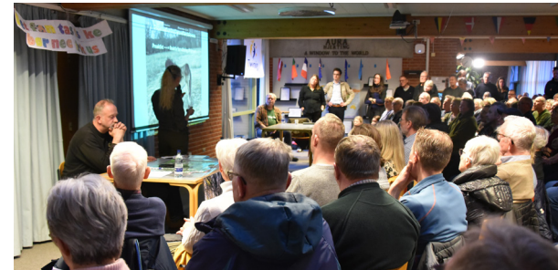
Man måtte presse sig i aulaen på Nordvangskolen for at være med. Her fortælles om hestenes forhold på Molslaboratoriet.

Protestmøde mod fredning en kæmpesucces HJERTING – Bilerne stod overalt, selv på græsarealerne omkring Nordvangskolen i Hjerting, da tre interessegrupper holdt orienterings- og protestmøde vedrørende den fredning af Marbæk plantage, som Danmarks Naturfredningsforening har foreslået uden at have kommunen som medforlagsstiller. Omkring 300 mennesker var kommet for at høre på, og det var hårrejsende historier, vi fik om blandt andet de vilde hestes forhold i Molslaboratoriet og om bisonokserne på Bornholm, der overhovedet ikke har det habitat, de egner sig til. Vi hørte også om Guldager Highland Cattle, der slet ikke vil kunne give dyrene den ro, de har brug for, når de konstant skal flyttes rundt, selv når de er drægtige. Tilhængere af fredningen var der ingen af. De var heller ikke inviteret, skal det dog siges. Fredningsnævnet for Sydjylland har i øvrigt, efter at kommunen har bedt om at være medbestemmende i fredningssagen, udsat høringsfristen til 1. juli.