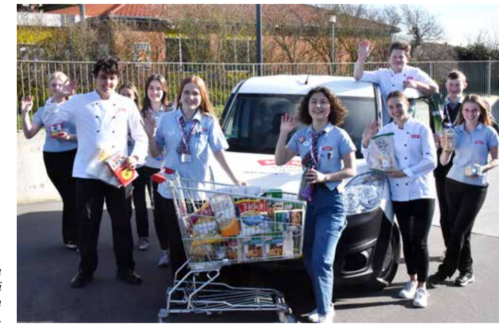
Under coronaepidemien tog ungarbejderne i Meny initiativ til en udbringningsservice.