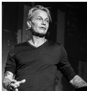
Jan Grarup kommer 2. maj.