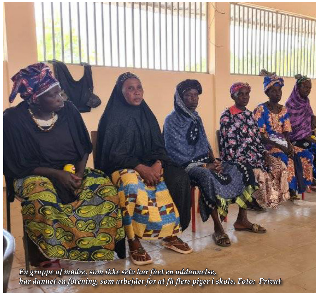
En gruppe af mødre, som ikke selv har fået en uddannelse, har dannet en forening, som arbejder for at få flere piger i skole.

“De børn jeg startede med at hjælpe, er jo næsten voksne og har børn. De er blevet mine venner, og det er dejligt at se, at de har det