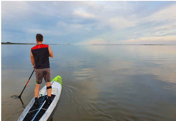
Stand up paddle trækker mange til.