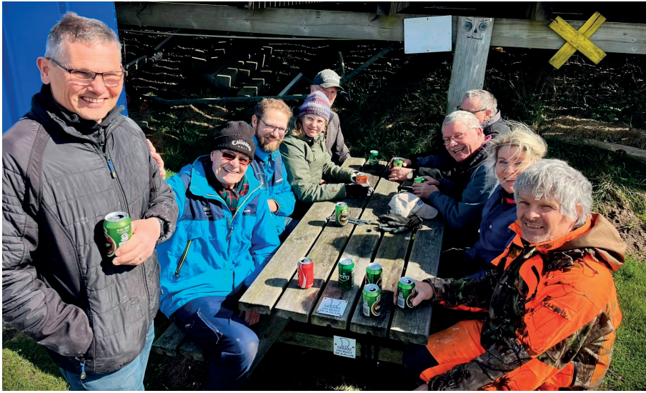
røverhistorier fra de foregående sæsoner over de veltilberedte lækkerier