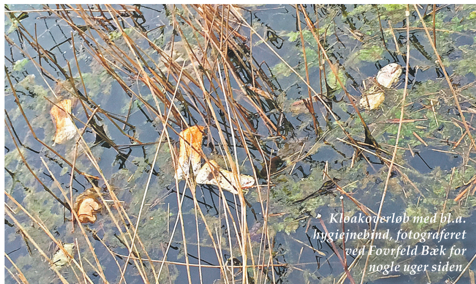
Kloakoverløb med bl.a. hygiejnebind, fotograferet ved Fovrfeld Bæk for nogle uger siden

En af de mere synlige situationer ses på billedet her nedenfor, der er taget ved Fovrfeld Bæk for nogle uger siden.