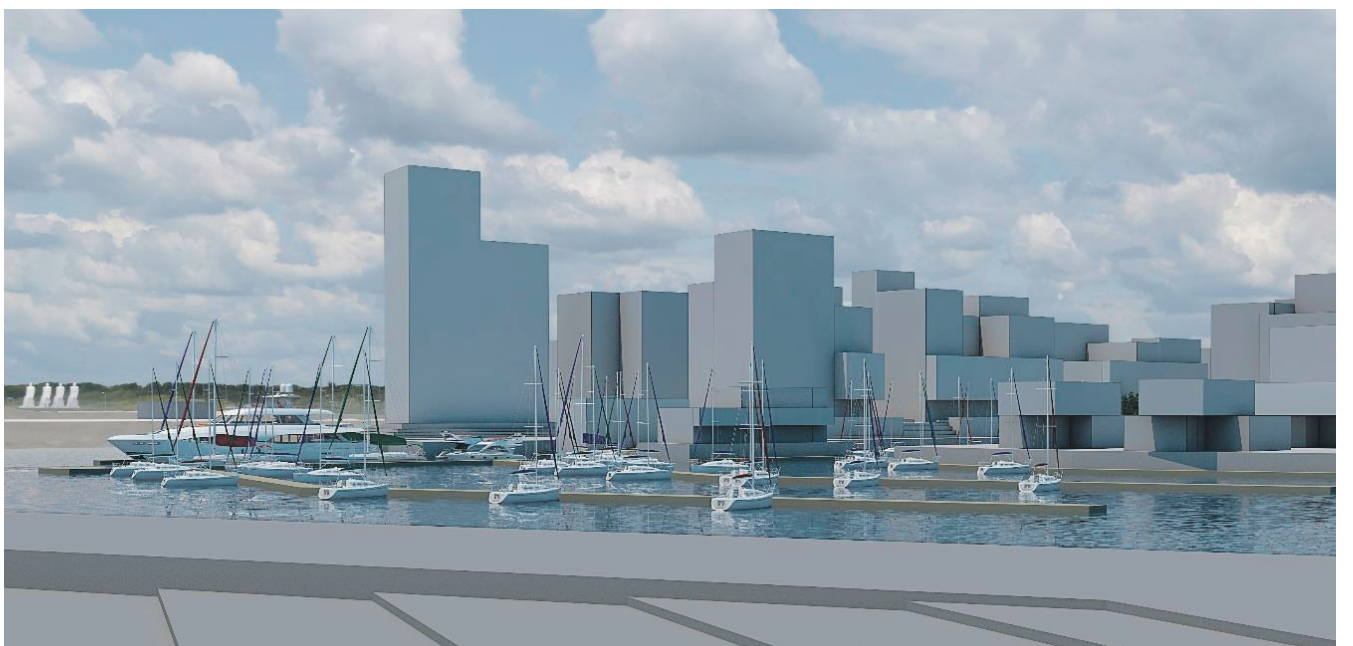
Det nye havneområde giver mulighed for kajplads til op imod 300 lystbåde og midt på Havneøen tillades byggeri i op til 11 etager.

Meget markant udtryk Overordnet beskrives elementerne i den nye lokalplan bl.a. som 'markante' og 'karakterskabende' for både området og for hele